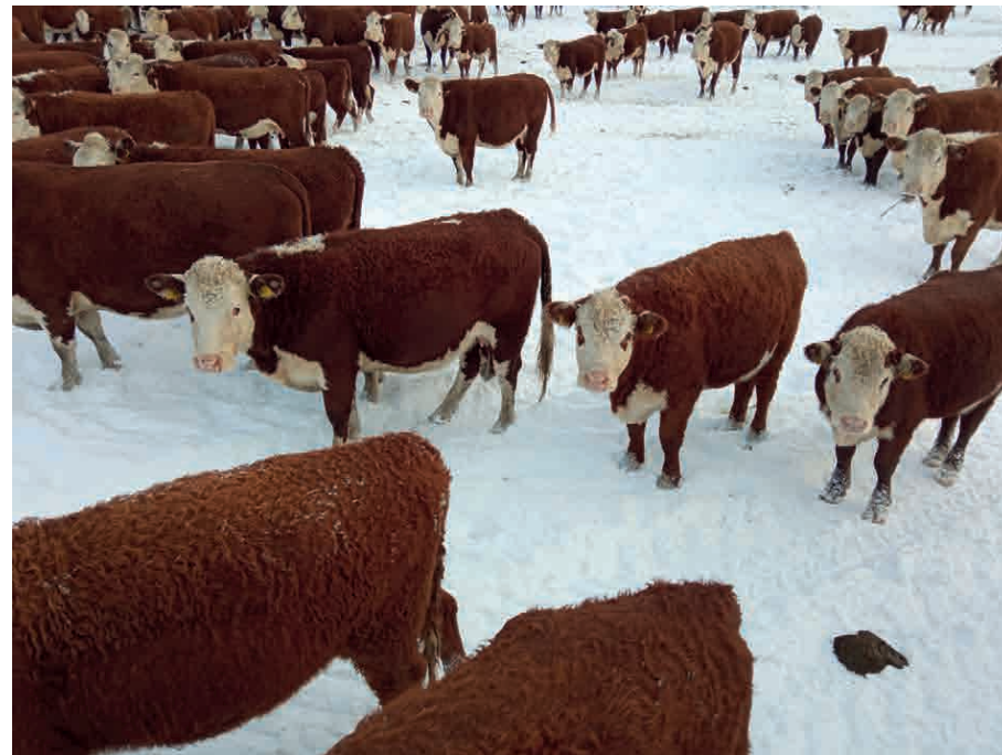
Bydło rasy hereford nadzwyczaj szybko i łatwo aklimatyzuje się w skrajnie trudnych warunkach klimatycznych.

Gospodarstwo zlokalizowane jest w niezwykle atrakcyjnym przyrodniczo zakątku Warmii, na obszarze NATURA 2000. Kilkusethektarowe, objęte systemem rolnictwa ekologicznego pastwiska, zapewniają doskonałe warunki dla bydła mięsnego rasy hereford. Przez 7 miesięcy w roku zwierzęta żywią się głównie na pastwiskach, a w okresie zimowym spożywają wyłącznie sianokiszonkę i siano pochodzące z trwałych użytków zielonych należących do gospodarstwa. Bydło rasy hereford nadzwyczaj szybko i łatwo aklimatyzuje się w skrajnie trudnych warunkach klimatycznych i doskonale znosi ekstensywny pastwiskowy system utrzymania. Może przebywać całodobowo na pastwisku, nie wymagając przy tym pomieszczeń inwentarskich. W gospodarstwie Futura XXI Sp. z o.o. hodowla prowadzona jest od 1999, obecnie stado liczy około 350 mamek, a w kolejnych latach będzie stale odmładzane i powiększane.