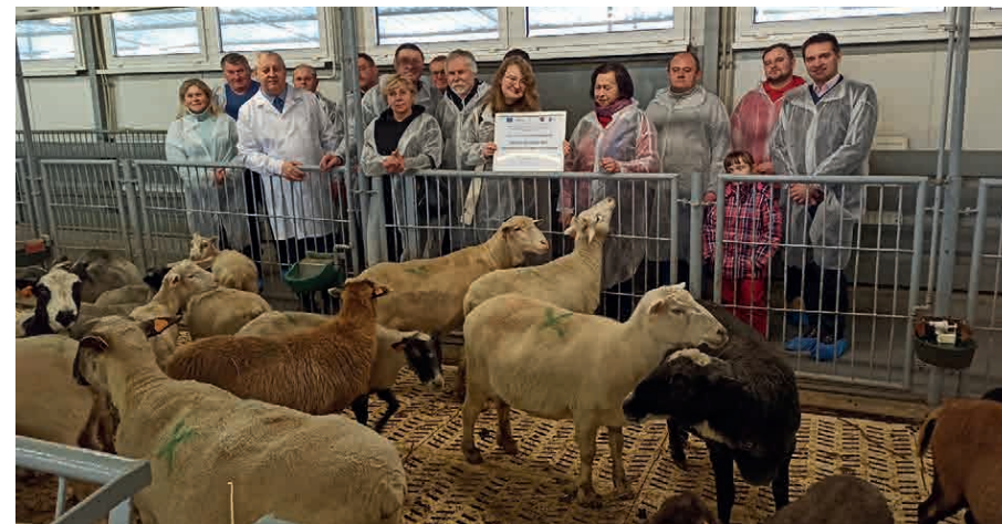
Laboratorium Zwierzęce jest otwarte dla każdego, komu zwierzęta są bliskie i kto chciałby się czegoś o nich dowiedzieć.

Przykładem demonstracyjnych działań Stacji mogą być Dnia Pola zorganizowane 24 czerwca 2022 r., pod nazwą „Nowe odmia-