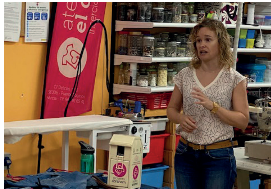
Podczas spotkań uczestnicy prezentują swoje zadania i materiały, konsultują je w gronie partnerów, wymieniają poglądy oraz pracują nad przygotowaniem zadań na kolejne spotkania.

Podstawowymi grupami docelowymi są nauczyciele i uczniowie, zarówno w instytucjach kształcenia i szkolenia zawodowego (VET) na poziomie średnim, jak i w szkolnictwie wyższym. Drugorzędne grupy docelowe to przedsiębiorstwa społeczne i lokalni interesariusze zaangażowani we wspieranie włączenia społecznego, np. poprzez oferowanie możliwości pracy, zatrudnienia i handlu grupom społecznie wykluczonym. Wszyscy partnerzy uczestniczący w projekcie promują integrację społecznej gospodarki cyrkularnej.