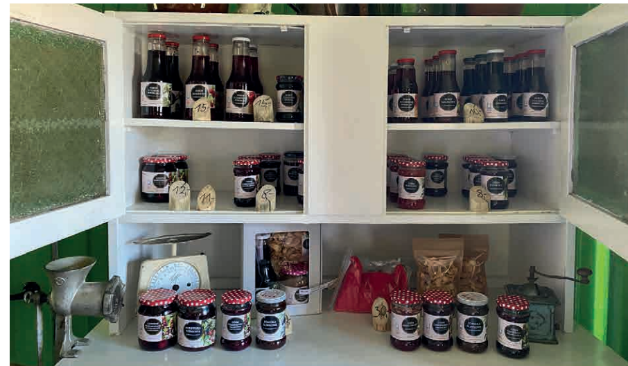
Owocowy Raj.

W skład Regionu Zagórzańskiego wchodzi: Gmina Mszana Dolna, Miasto Mszana Dolna i Gmina Niedźwiedź. Wcześniej zagórzańskie gminy oraz inne podmioty, instytucje i organiza-