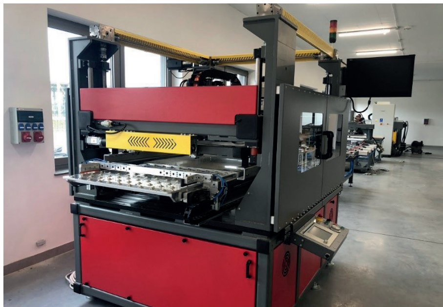
Maszyna sitodrukowa. Źródło: zasoby konkursu.

Firma WJATECH Sp. z o.o. prowadzi działalność od 2015 r. zajmując się produkcją wysoce nowatorskich technologicznie maszyn, których celem jest optymalizacja procesu produkcji. Głównymi odbiorcami są przedsiębiorstwa produkcyjne działające w różnych branżach gospodarki, w tym m. in. w sektorze lotniczym, budowlanym, maszynowym, wydobywczym, motoryzacyjnym. Nagrodzonym w konkursie przedsięwzięciem jest maszyna sitodrukowa przeznaczona do nanoszenia warstw światłoczułych na taflach szklanych metodą sitodruku w cyklu automatycznym. Charakteryzuje się ona wysokim stopniem innowacyjności konstrukcji na skalę światową. W wyniku produkcji tej oraz innych maszyn prototypowych firma zapewnia 36 osobom stałe zatrudnienie na umowę o pracę i ciągle się rozwija, zatrudniając nowych pracowników.