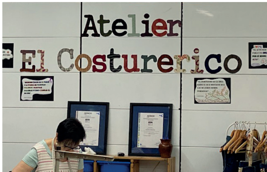
Spotkania grupy roboczej w Hiszpanii. (Fot. Przemysław Lecyk CDR O/Poznań).

Można oczekiwać, że gospodarka cyrkularna będzie miała pozytywny wpływ na tworzenie miejsc pracy, pod warunkiem, że pracownicy zdobędą umiejętności wymagane w ramach tzw. „zielonej transformacji”, której celem jest przede wszystkim uświadomienie ludzkości, że należy podjąć konkretne działania, aby zapobiec samodestrukcji. Działania te wpisują się