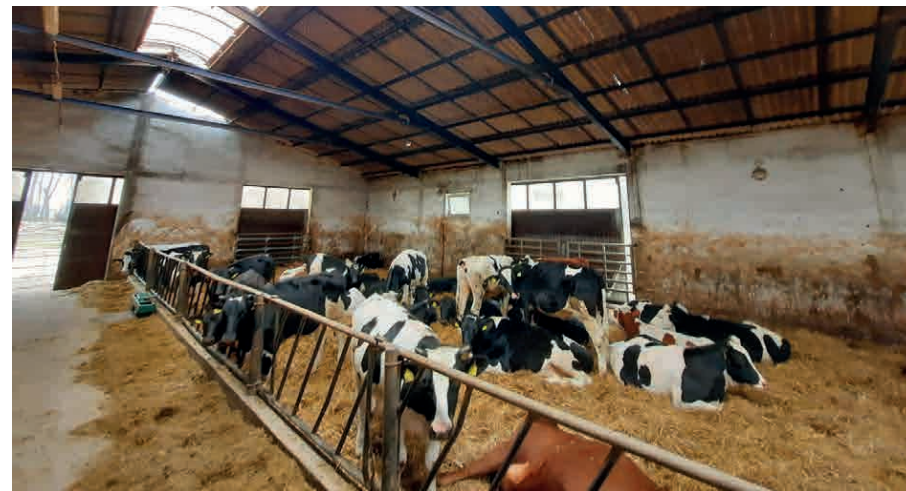
Celem projektu było zwiększenie innowacyjności i konkurencyjności polskiego sektora wołowiny.

możliwość poznania wyników porównywania efektów działania różnych środków ochrony roślin oraz różnych dawek nawozów.