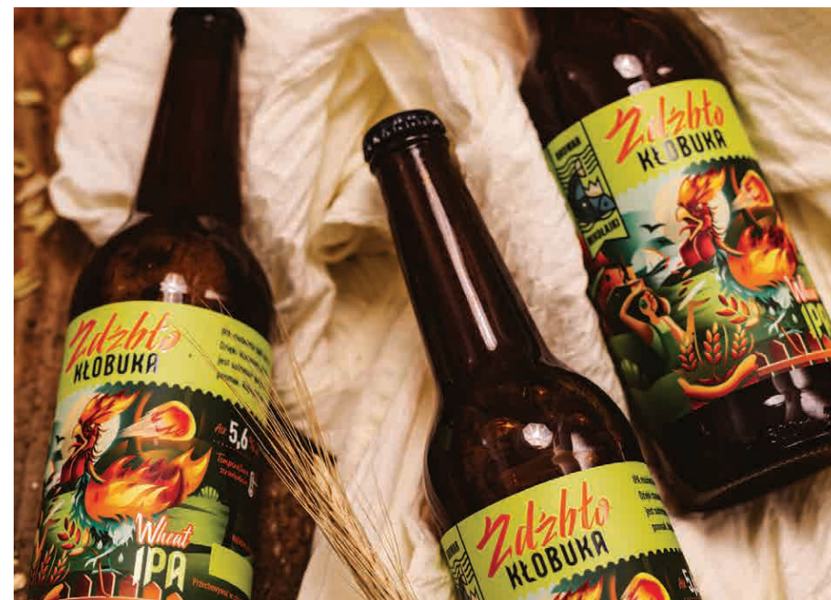
Browar Mikołajki.