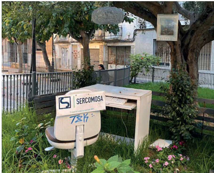
Organizacje te tworzą miejsca pracy, oferują ochronę socjalną i inne formy wsparcia dla ludzi stojących przed wyzwaniami społecznymi.

Spółeczna ekonomia cyrkularna oraz jednostki kształcenia i szkolenia zawodowego, w tym również doradztwo, wprowadzają innowacyjne podejście do promowania postaw sprzyjających zrównoważonemu rozwojowi środowiska oraz ponoszeniu odpowiedzialności społecznej w tym obszarze. Bardzo często organizacje społeczne działają tam, gdzie dotychczasowe działania administracyjne zawiodły lub nie są w stanie zaspokoić