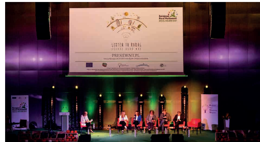
Obrady Europejskiego Parlamentu Wiejskiego.

Obrady Europejskiego Parlamentu Wiejskiego trwały cztery dni. Jak dowodzi powyższy głos jednej z uczestniczek, były doskonałą okazją do wymiany doświadczeń i wiedzy między społecznościami wiejskimi z całej Europy, których przedstawiciele zgodnie twierdzili — praca dopiero się zaczyna.