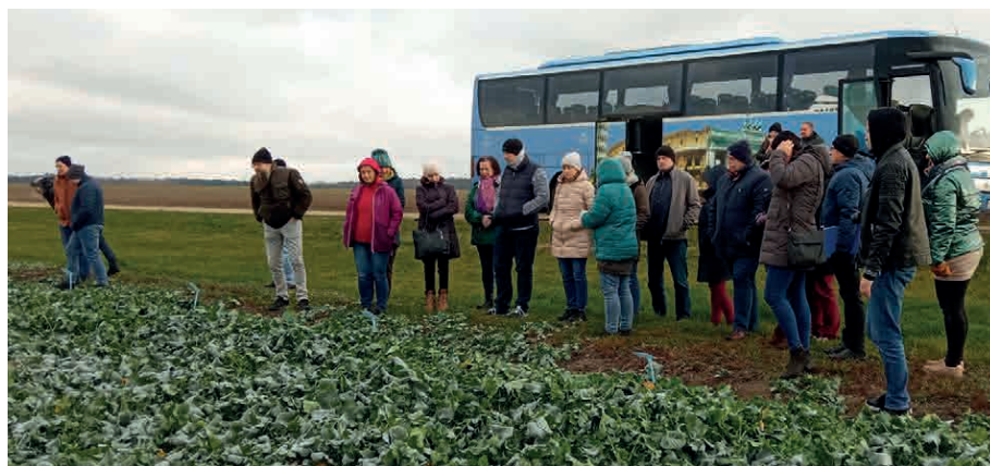
Pole Doświadczalne Mazowieckiego Ośrodka Doradztwa Rolniczego w Oddziale Poświętne w Płońsku. (Fot. Barbara Grybo CDR, w Brwinowie).

Pole Doświadczalne Mazowieckiego Ośrodka Doradztwa Rolniczego w Oddziale Poświętne w Płońsku , o którym była już mowa powyżej, było miejscem poznania prac nad badaniem odmian żyta ozimego, pszenicy ozimej, pszenżyta ozimego, jęczmienia ozimego i rzepaku ozimego – głównie pod kątem poszukiwania odmian zalecanych dla województwa mazowieckiego. Była tu również