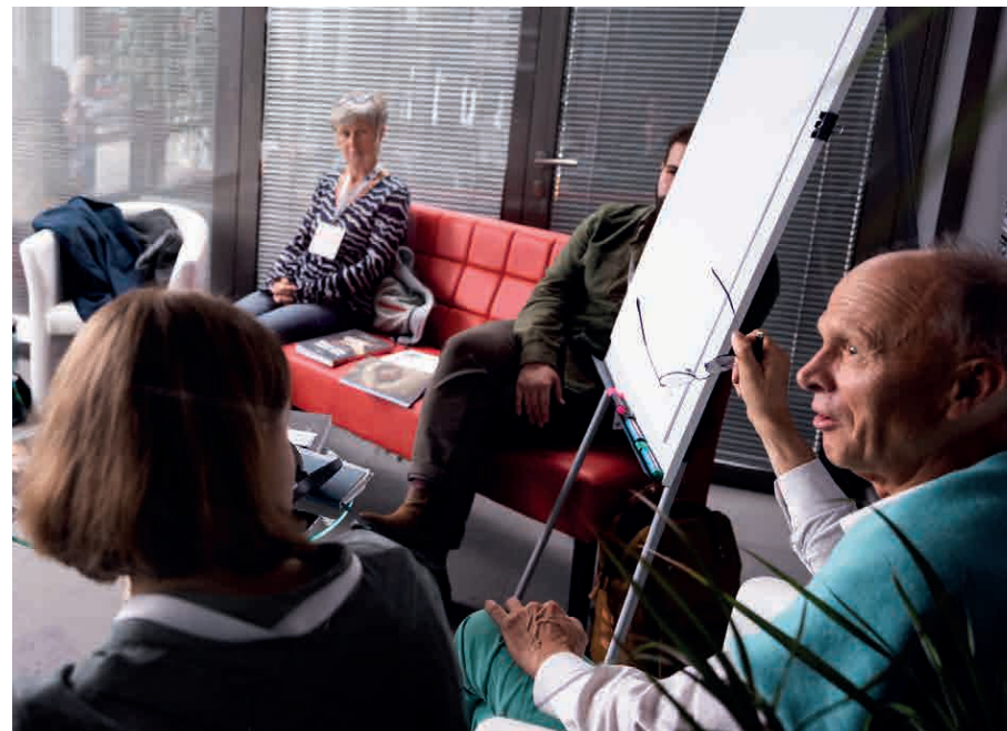
Uczestnicy V spotkania Europejskiego Parlamentu Wiejskiego, Kielce 2022 r. (Fot. Mariusz Rutkowski, CDR O/Warszawa).

Ideji, u której historycznych podstaw, leży tworzenie przestrzeni przede wszystkim dla praktyków wsi — jej mieszkańców, często najlepiej potrafiących wskazywać problemy dotyczące ich lokalnych podwórek, a jednak równie często — będących przeświadczonych o tym, że głosy padające z ich strony mają marginalne znaczenie w procesie decydowania o przyszłości.