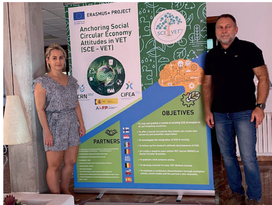
Spotkania grupy roboczej w Hiszpanii.

Przedstawicielami poszczególnych państw są organizacje, przedsiębiorstwa, szkoły i stowarzyszenia działające na rzecz rozwoju doradztwa i szkolnictwa zawodowego. Polskę reprezentuje Stowarzyszenie Edukacji Rolniczej i Leśnej EUROPEA Polska, zrze-