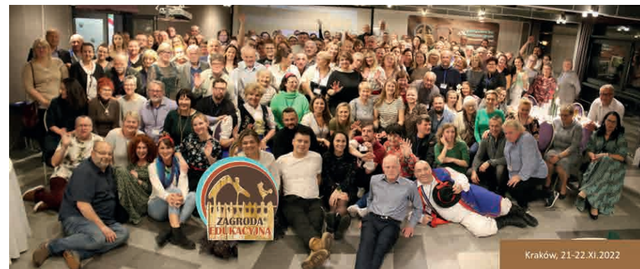
Uczestnicy VII Ogólnopolskiego Zlotu Zagród Edukacyjnych.

Marka zagród edukacyjnych zyskuje coraz większą rozpoznawalność. To wiarygodny znak, pozwalający zdobywać nowych klientów. Budowanie i rozwój sieci zagród odbywa się na trzech poziomach – lokalnym, regionalnym i krajowym, które wzajemnie się uzupełniają i wspierają.