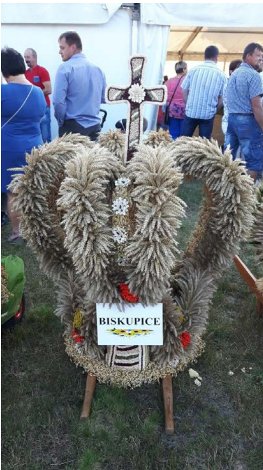
Dożynki oraz wyplatanie korony to bardzo ważna część kultywowania tej pięknej tradycji.