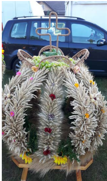
Piękny wieniec dożynkowy, w którego wyplatanie zaangażowane są wszystkie mieszkanki wsi kultywujące tradycyjny, lokalny zwyczaj.