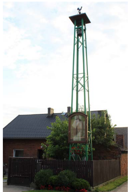
Dzwon w centrum wsi - przed wojną pełnił rolę zegara informującego o godzinach np. pory obiadowej czy końca prac w polu. Dzwon jeszcze do niedawna uruchamiali mieszkańcy co stanowiło nie lada poświęcenie. Nieprzerwanie dzwoni do dziś.