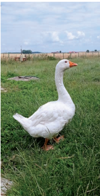
Pierzajki to jeden z kultywowanych zwyczajów, który kończy się doskubkiem, czyli małą biesiadą dla wszystkich uczestników pierzajek.