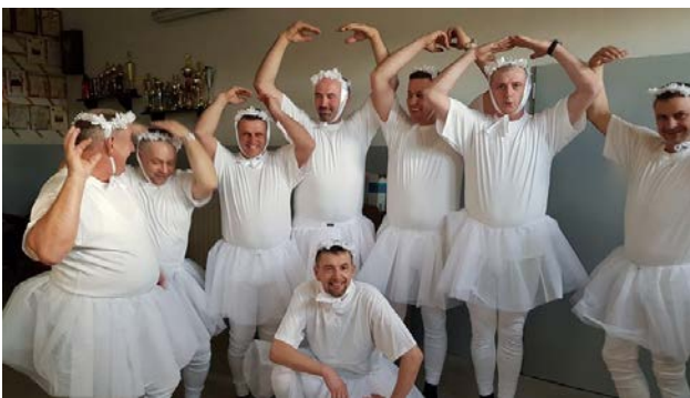
Dzień Kobiet, dożynki wiejskie to imprezy organizowane przez sołectwo.

Nowe Karmonki ze Starymi Karmonkami stanowi od dłuższego czasu wypadowe miejsce rowerzystów a także pieszych spacerowiczów. Szczególnie istotną rolę odgrywa tutaj bliskość natury oraz piękne krajobrazy zmieniające się w zależności od pory roku. Drugim miejscem wypadowym i sprzyjającym wycieczkom np. jeździe na rolkach jest droga na Miłęcin, z której korzystają również mieszkańcy ościennych miejscowości. Organizacją działającą w sołectwie jest Ochotnicza Straż Pożarna.