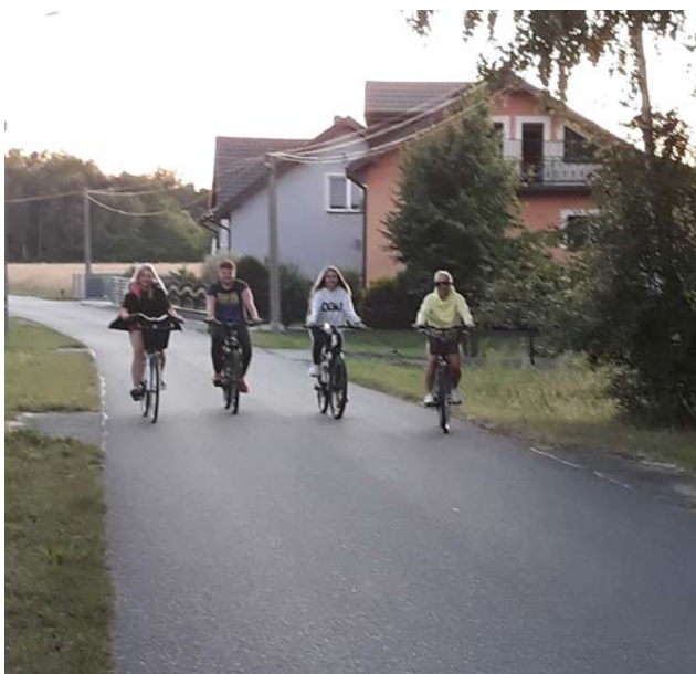
Ze względu na brak typowej ścieżki rowerowej droga biegnąca przez wieś jest ulubioną trasą rowerową dla mieszkańców sąsiednich sołectw.