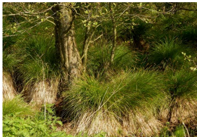
Dzika przyroda to przede wszystkim ugory porośnięte zagajnikami obfitującymi w wiele rzadkich gatunków roślin.

w życie społeczne całej gminy. Plac wiejski – jedyna publiczna przestrzeń w Odcinku – jest sukcesywnie zagospodarowywany przez mieszkańców i z roku na rok staje się coraz bardziej atrakcyjnym miejscem ich integracji podczas pracy i zabawy (ognisk, festynów, spotkań rekreacyjno-sportowych). Większość tych przedsięwzięć inicjuje i koordynuje Grupa Odnowy Wsi Odcinek.