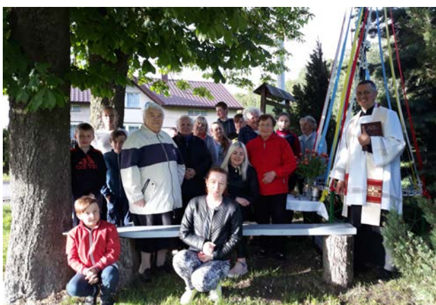
Mieszkańcy Odcinka od pokoleń są wierni tradycji odprowadzania nabożeństw majowych przy krzyżu i kapliczce.

Sołectwo położone w północnej części gminy Rudniki. Panujące tutaj cisza i spokój sprzyjają odpoczynkowi i rekreacji w otoczeniu sielskiego krajobrazu. Obfitość ziół i owoców dziko rosnących krzewów przyciąga amatorów zbieractwa. Z uwagi na brak podstawowych obiektów użyteczności publicznej, miejscem zaspokajania edukacyjnych, religijnych i kulturalnych potrzeby mieszkańców Odcinka jest sąsiadujący z nim Dalachów. Mimo ograniczeń wynikających ze słabo rozwiniętej infrastruktury, tutejszą ludność cechuje duża aktywność i zaangażowanie