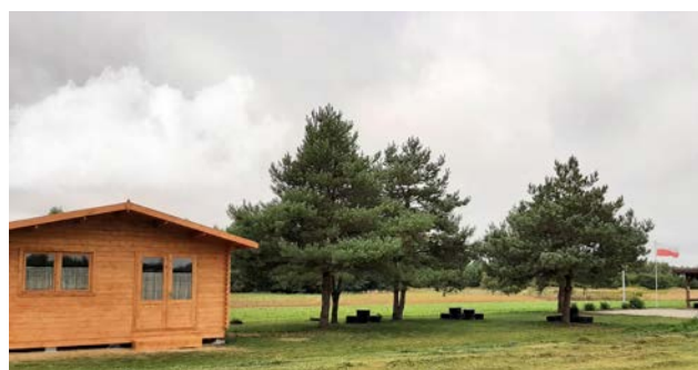
Pięknie zagospodarowany plac wiejski w Odcinku z masztem flagowym.