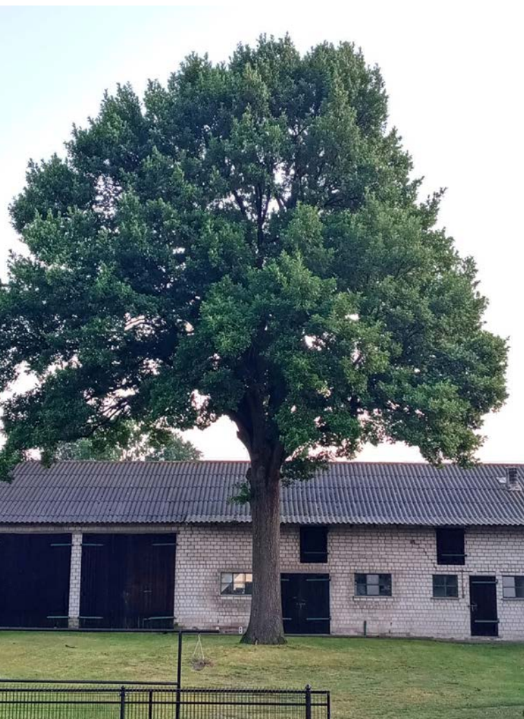
W środku wsi rośnie okazały dąb, którego wiek szacuje się na ok. 150-180 lat.

znaleźć ślady z czasów II wojny światowej. Organizacjami działającymi w sołectwie są: Rada Sołecka, Grupa Odnowy Wsi oraz Ochotnicza Straż Pożarna.