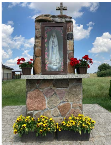
Mieszkańcy dbają o wygląd kapliczki, przy której odbywają się nabożeństwa majowe.