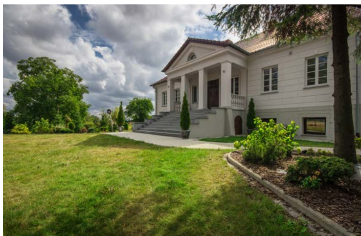
Dwór w zespole parkowym, z poł. XVIII w. 1832 roku. Wpisany na listę zabytków Narodowego Instytutu Dziedzictwa.