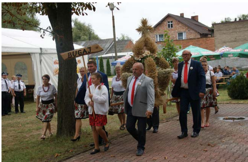
Udział w dożynkach gminnych to wyraz dbałości o zachowanie lokalnego dziedzictwa.