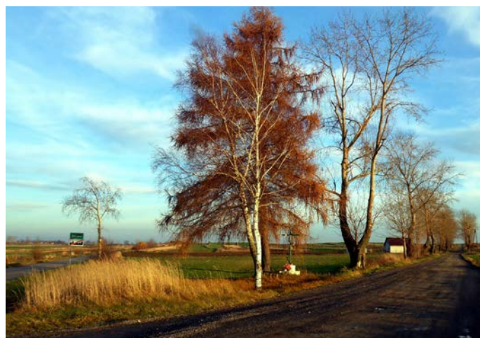
Malownicza droga w Bugaju.