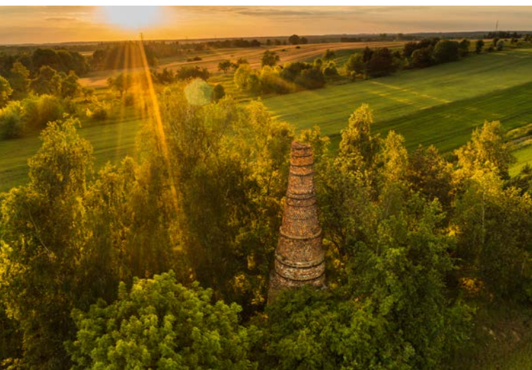
Wapiennik w Młynach z 1958 roku. Wybudowany w okresie dużego zapotrzebowania na wapno palone. Funkcjonował do połowy lat 70. XX wieku.