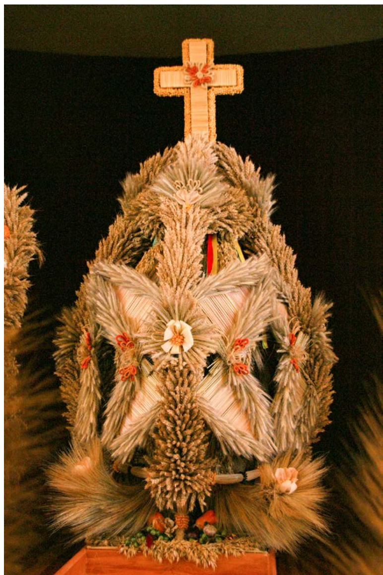
Tradycja wyplatania koron żniwnych przekazywana jest kolejnym pokoleniom przez twórczynię ludową z Młynów, która w ramach inicjatywy LGD prowadziła również wykłady i warsztaty dla mieszkańców Górnej Prosn.