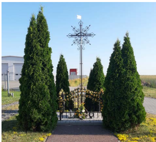
Stojący w centralnym punkcie wioski krzyż z 1945 roku przyciąga swoich mieszkańców, którzy od lat odśpiewują przy nim nabożeństwa majowe. Ta spontaniczna i radosna tradycja jest niezwykle zakorzeniona w polskiej tradycji.