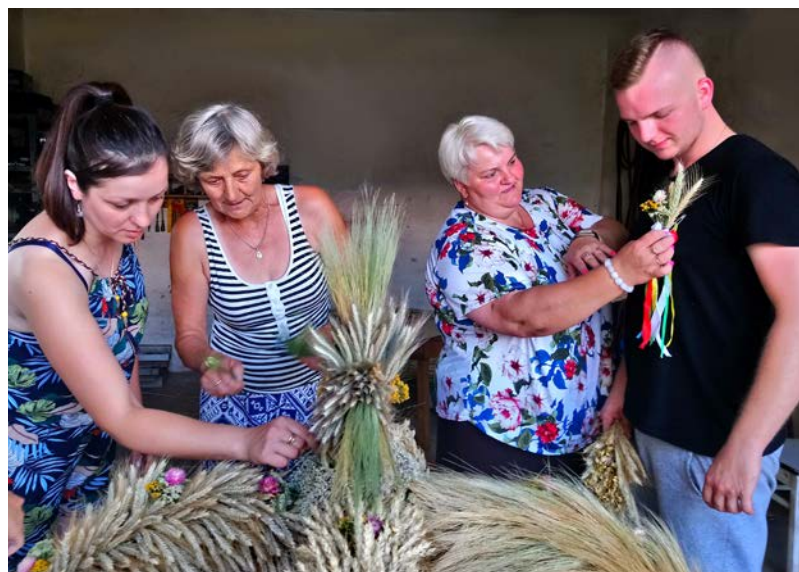
Kultywowanie tradycji tworzenia wieńca dożynkowego przekazywane jest z pokolenia na pokolenie.