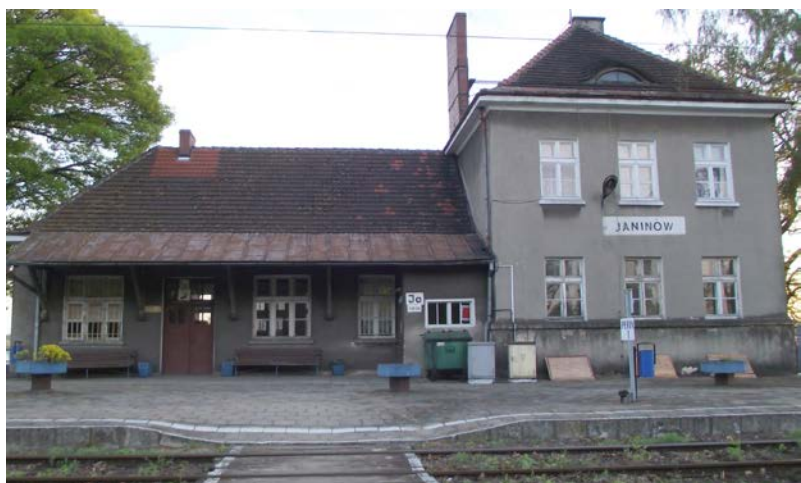
Wciąż działająca stacja PKP w Janinowie obsługująca linię kolejową 181 Herby Nowe - Oleśnica - otwarta w 1926 roku.