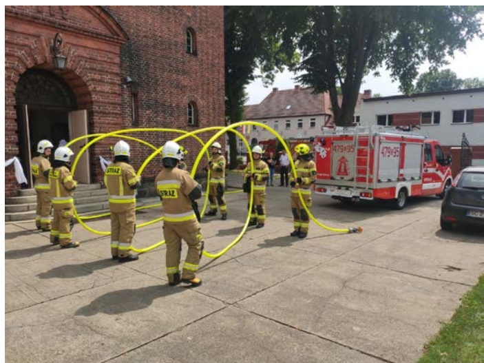
Dzięki staraniom druhów OSP wyremontowane zostały remiza, sala, zakupiono nowy wóz oraz serce na nakrętki. Dzielni strażacy towarzyszą swoim „kolegom z OSP” we wszystkich ważnych, życiowych wydarzeniach.