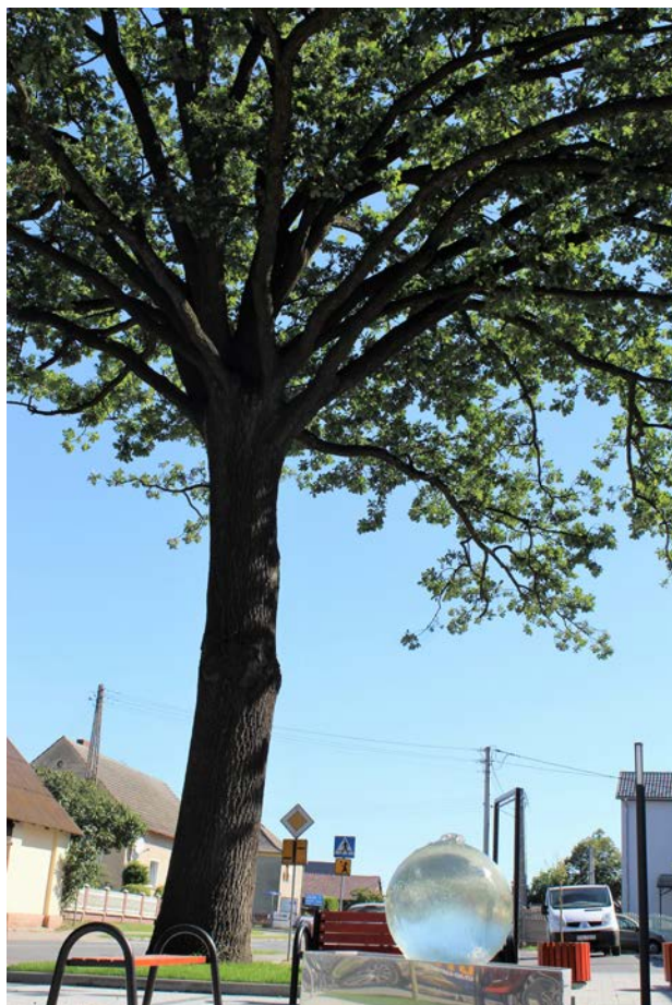
Dąb szypułkowy – stanowiący pomnik przyrody, upiększa centrum wsi.

miejscowości Radlow została wymieniona w 1679 roku, natomiast pierwszą adnotację o radle znajdujemy już w 1392 roku. Od 1845 r. figuruje jako Radłów. We wsi funkcjonował szpital z 1660 roku stanowiący przytułek dla ubogich, obecnie znajdujący się w Bierkowicach. We wsi znajduje się Publiczna Szkoła Podstawowa, o której pierwsza wzmianka pochodzi z 1755 roku. Ciekawostką stanowi fakt, iż wioska do XVII wieku była zależna od dworu w Starych Karmonkach, którego pozostałości można zobaczyć do dziś. Jeszcze w latach 50-tych, 60-tych w sołectwie był jedynie telefon, mały sklep i szkoła, a teraz jest to miejscowość gminna, która ciągle pięknieje i się rozwija. Organizacjami działającymi w sołectwie są Ochotnicza Straż Pożarna, Koło DFK oraz Ludowy Zespół Sportowy. O zachowanie w pamięci lokalnej historii tradycji i kultury od 1999 roku dba Koło Miłośników Historii Lokalnej.