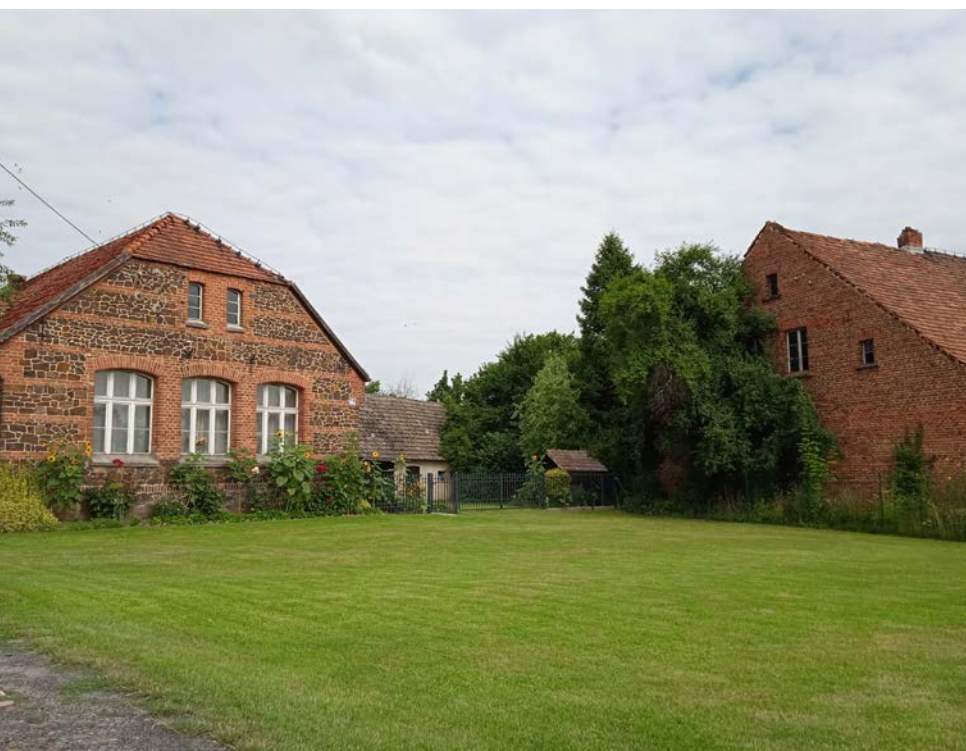
Dwie stare szkoły – ewangelicka i katolicka.

Wyjątkowy okaz sosny w kształcie litery H znajdujący się przy drodze prowadzącej z Gołej w kierunku Budzowa.