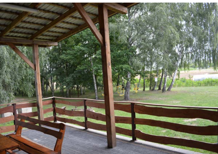
Centrum Integracji Sołeckiej – plac, na którym odbywa się życie kulturalne w sołectwie, tętni życiem nie tylko podczas wiejskich imprez, ale także na co dzień, gdy korzystają z niego najmłodszy.