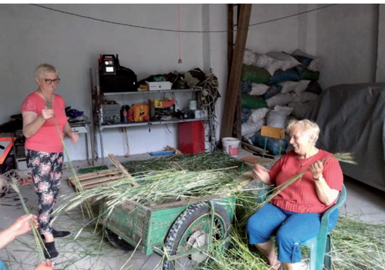
Dożynki wiejskie – reaktywowane święto, w którym uczestniczą wszyscy mieszkańcy wsi.

dwie części: jedna część należy do parafii Stojec, a druga do Praszki. Sołectwo działa aktywnie na wielu płaszczyznach dzięki organizacjom funkcjonującym na jego terenie. Prężnie działające Koło Gospodyń Wiejskich i Ochotnicza Straż Pożarna pozyskują dotacje i wygrywają nagrody, promując tym samym niewielkie sołectwo.