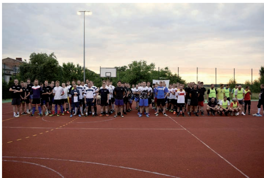
Nocny turniej piłki nożnej o puchar Prezesa OSP Dalachów.