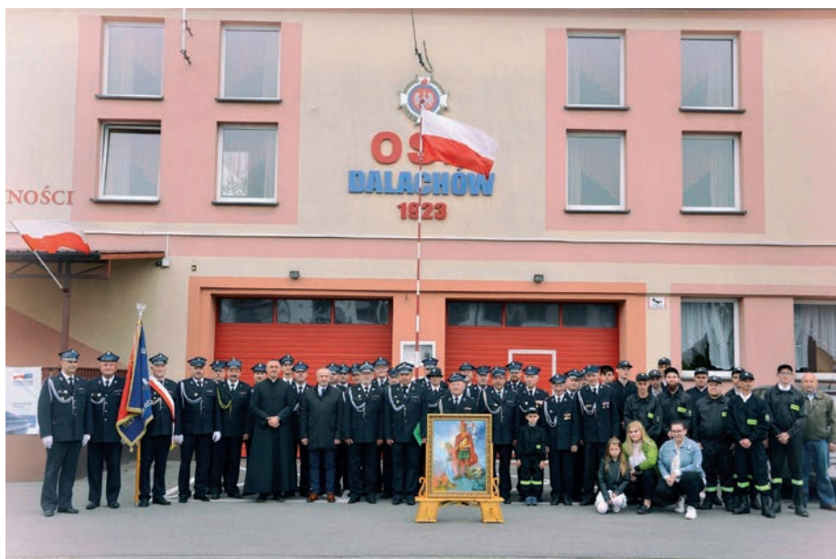
Ochotnicza Straż Pożarna działająca prężnie od 1923 roku.