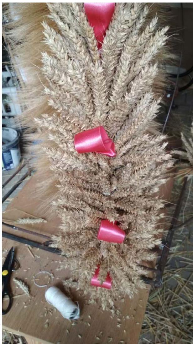
Coroczne wyplatanie wieńca dożynkowego, w którym bierze udział około 100 pań.

czołowych 247-250 m n.p.m. W pobliżu wsi nie występują lasy, są natomiast stawy – siedliska ptactwa wodnego. W okresie wiosennym wieś żółci się od mniszka lekarskiego.