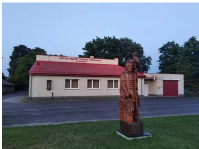
Ośrodek Tradycji Wiejskiej i Strażackiej w Ciecuiłowie – miejsce integracji mieszkańców.