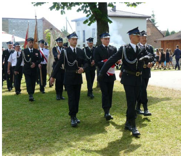
Festyn z okazji 105 – lecia istnienia OSP Ciecuiłów.